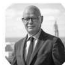
Edouard PHILIPPE Ancien Premier Ministre Maire du Havre Young Leader France-Chine 2013