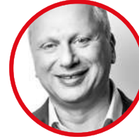
Aiman Ezzat Capgemini 議員、オーストラリア代表 Thibaud Frossard によって