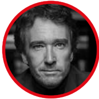
Antoine Arnault LVMH代表、オーストラリア代表、ステファ ン・リンダークネックとマルク・アントワー ヌ・ジャメ