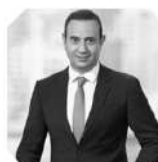
Fabrice MÉGARBANE グローバル・グロース最高責任者 ロレアル 2020年フランス・中国ヤングリーダー