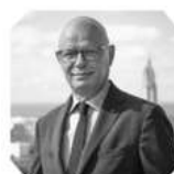
Edouard PHILIPPE 元首相 ル・アーヴル市長 2013年フランス・中国ヤングリーダー