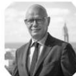
Edouard PHILIPPE エドゥアール・フィリップ ル・アーヴル市長・元首相 2013年フランス・中国ヤングリーダー