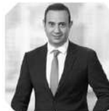
Fabrice MÉGARBANE ファブリス・メガルバン ロレアル グローバル・グロース最高責任者 2020年フランス・中国ヤングリーダー