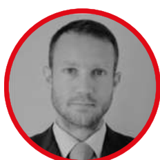
Jérôme Chardon ジェローム・シャルドン 軍事部国防武官室 海軍大佐 在日フランス大使館