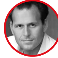
Arnaud Ventura フランス・アジア財団 代表 兼 共同創設者